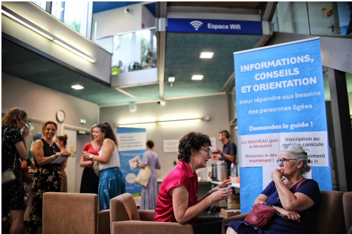
Espace seniors de proximité dans le Pôle Daniel Asseray

D'ici 2027, cinq espaces seniors au total seront créés , comprenant les 2 déjà créés, dans des structures municipales tout public, déjà connues et fréquentées, pour toucher le plus grand nombre de seniors et agir en prévention.