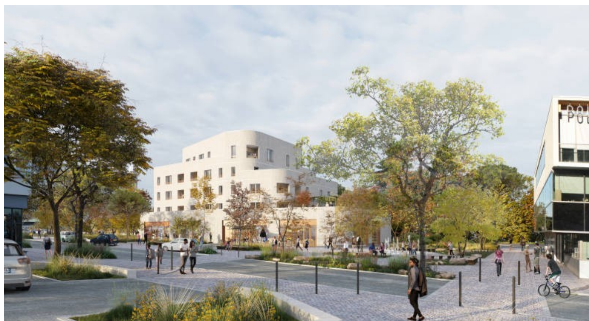
Vue de la place des Dervallières

Réunion Publique – mardi 20 septembre 2022