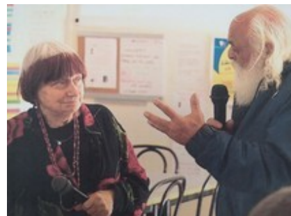
Agnès Varda au restaurant social, avec Yvon Chamela, un usager du restaurant qu'elle a filmé dans son documentaire « Les Glaneurs et la Glaneuse », décédé depuis. (2000)

Nommer l'établissement avec un nom féminin correspond en outre à l'engagement de rendre plus visibles les actions des femmes dans l'espace public. Ainsi, la Maire de Nantes a proposé le nom d'Espace Agnès Varda à sa famille, qui l'a accepté, puis une délibération a été votée par le Conseil Municipal, pour une ouverture le 16 mars 2020.