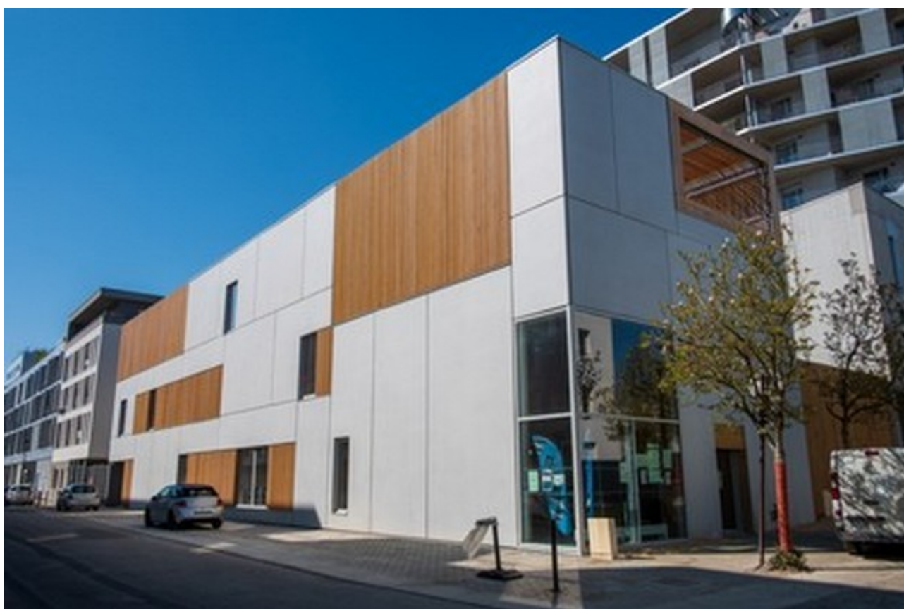
Espace Agnès Varda