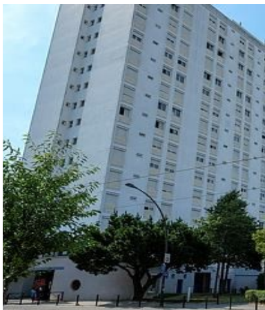
La tour du Doubs, rue Romain-Rolland