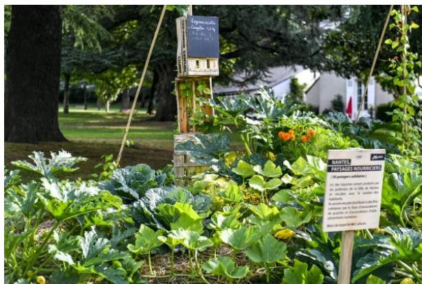
Phase 2 : la culture et l'entretien des parcelles (juillet > octobre 2020)