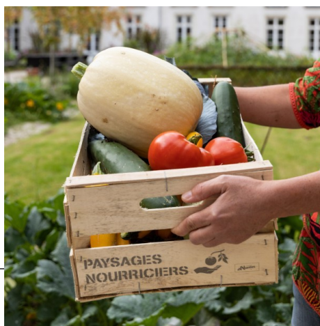
Phase 3 : la récolte des légumes (juillet > octobre 2020)