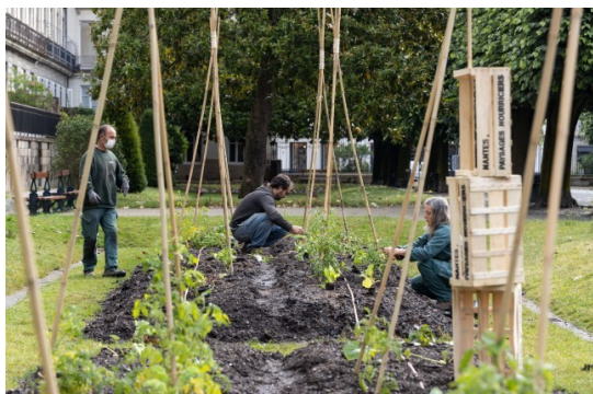
Juin 2020 : Opération de plantations des potagers Cours Cambronne par les jardiniers de la Ville

Ces bénévoles sont ensuite revenus dans le courant de l'été pour aider les jardiniers à désherber les parcelles et récolter.