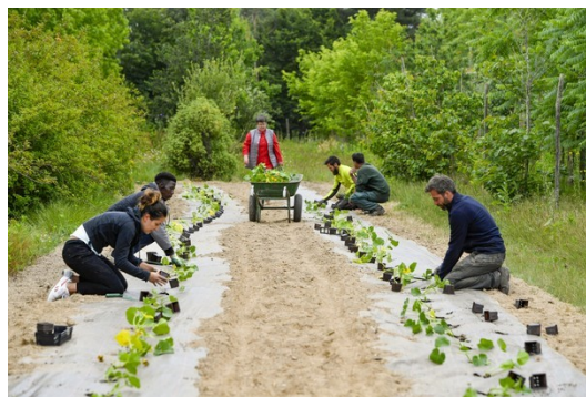
Juin 2020 : des sillons entiers de courges ont été plantés avec l'aide des bénévoles d'EmpowerNantes.