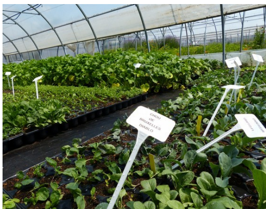
Juin 2020 : les plants de légumes sous les serres de la Pépinière du Grand Blottereau, en attente de plantation dans les divers sites de la Ville.