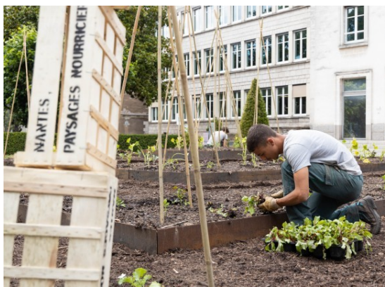
Phase 1 : la plantation des légumes (juin 2020)