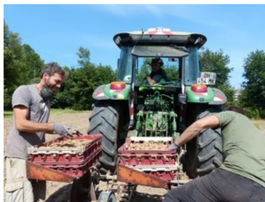
Juin 2020 : Opération de plantations de pommes de terre, dans le champs de la Pépinière Nantes Nord par les jardiniers et bénévoles d'EmpowerNantes