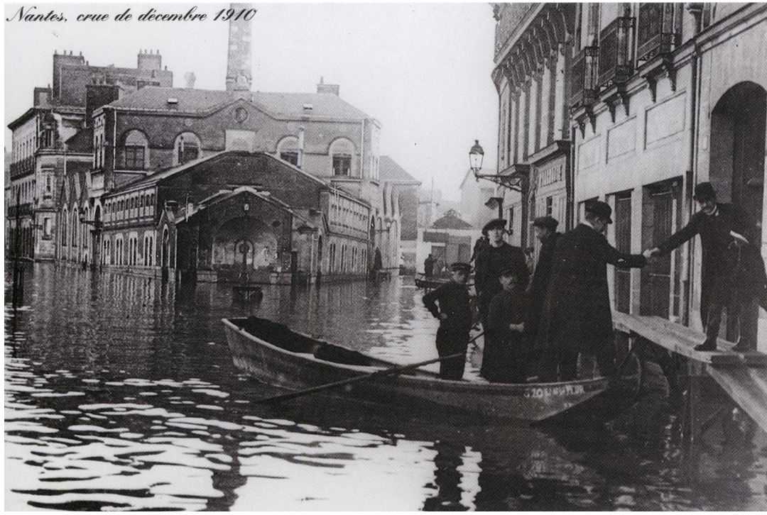
Nantes, crue de décembre 1910